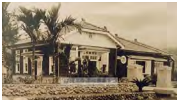
照片“吉野村郵局”(花蓮縣吉安鄉)