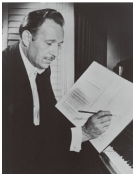
創始者:ロジェ・ワーグナー (1914~1992)

第2次世界大戦が終わった翌年1946年、ロサンゼルスセント・ジョセフ教会の若い合唱指揮者が、市主催の青年合唱団の音楽監督に任命されました。その合唱団の選抜メンバーが母体となって結成されたのが、のちに世界各国で演奏活動を行ない、80枚以上ものアルバムを発表することになる「ロジェ・ワーグナー合唱団」です。