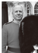
スチュアート・ ハリディーズ少佐