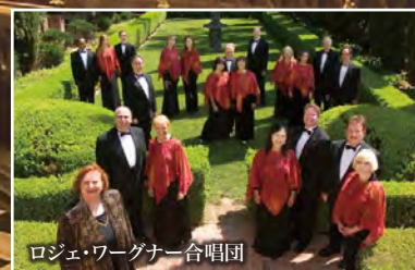
ロジェ・ワーグナー合唱団

1953年6月3日、エリザベス女王の戴冠式が行われ、ロジェ・ワーグナー合唱団がコーラスをつとめたウエストミンスター寺院聖堂。現在の上皇陛下が、19歳の時に昭和天皇名代として戴冠式に出席するため、3月30日に横浜港から御召船プレジデント・ウィルソン号で出発した。