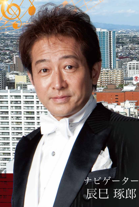
ナビゲーター 辰巳 琢郎