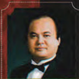
《レオポルド》 角田 和弘