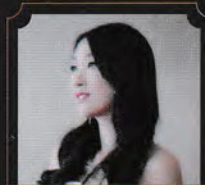
《オッティリエ》 三輪 英