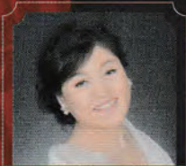
《ヨゼファ》 理寛寺 尚子