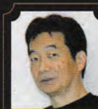
《皇帝》 生方 保光