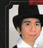
《ケテル》 月岡 哲夫